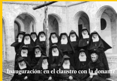
Inauguración: en el claustro con la donante

La construcción del convento se llevó adelante a base de la misma confianza en el Señor. Ella lo recuerda llena de reconocimiento: Al repasar el hacer de Dios, se hunde el alma en gratitud. Nunca nos ha faltado lo necesario; pero jamás nos ha dado lo superfluo. Y necesario, y más que necesario, era el Convento. Por eso, ¡adelante!, que Dios no puede faltar. Y no faltó. En ese múltiple hacer Suyo, en muy grandes apuros nos vimos, en hondísimas preocupaciones nos encontramos... pero, también en muy palpables ayudas y gracias, porque el 21 de noviembre de 1952, quedaba la Comunidad instalada en parte del nuevo y definitivo Convento.