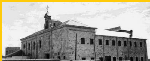
Convento de Salamanca recién terminado