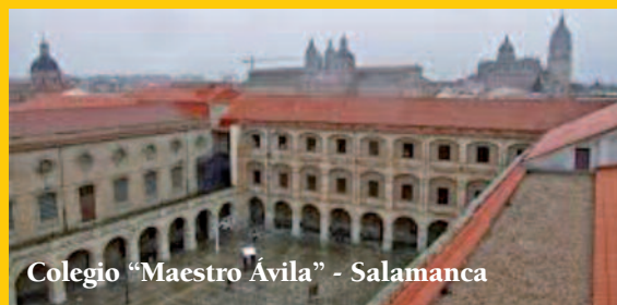
Colegio “Maestro Ávila” - Salamanca

Sin embargo, cuando los pisos restantes se van ocupando, se ve que la Casa no reúne ni las más mínimas condiciones para vivir en soledad y silencio. La