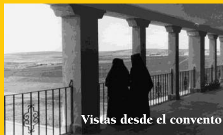
Vistas desde el convento